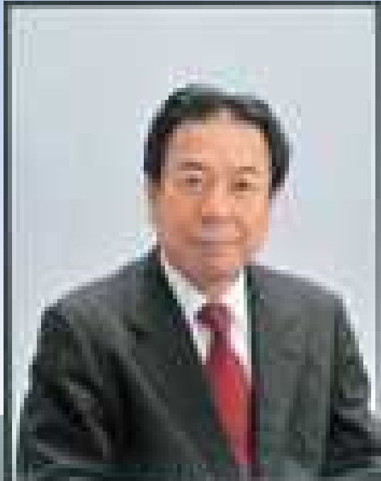
学長 楠見晴重(くすみ・はるしげ) 環境都市工学部教授