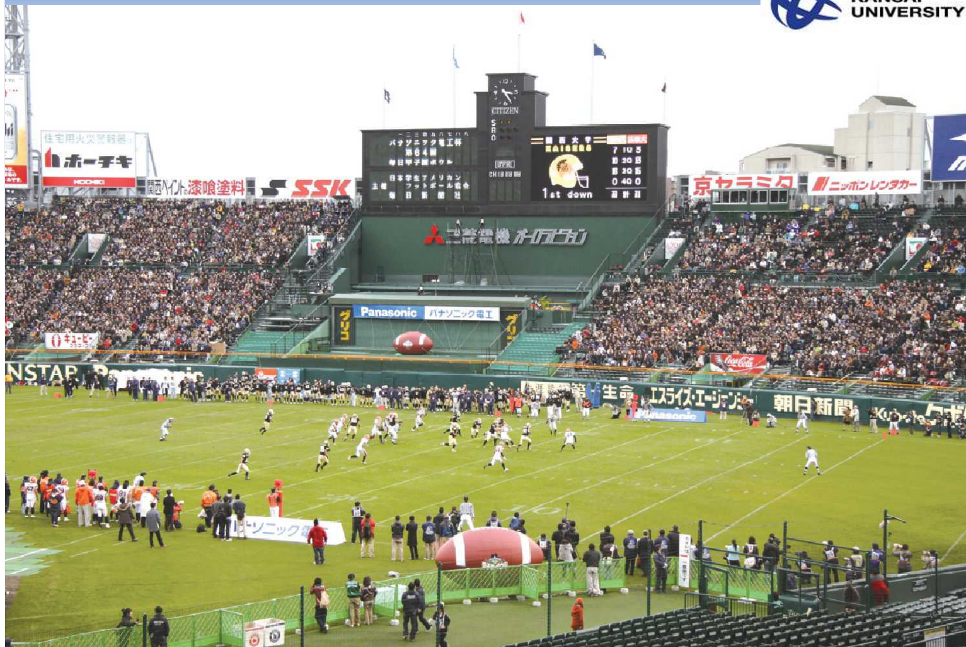
平成21年12月13日 アメリカンフットボール部・学生日本一の栄光！！