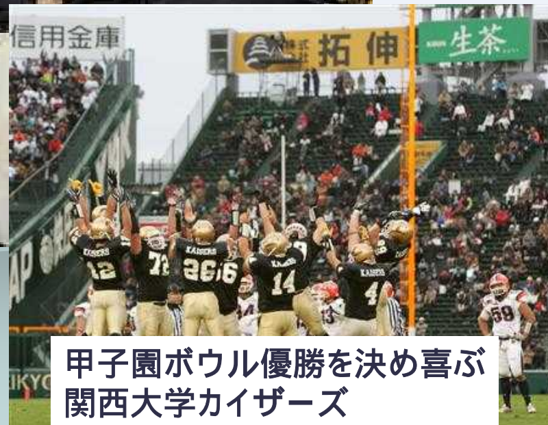
甲子園ポウル優勝を決め喜ぶ 関西大学カイザーズ