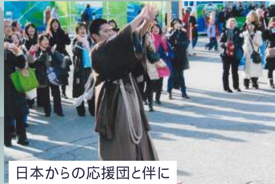
日本からの応援団と共に