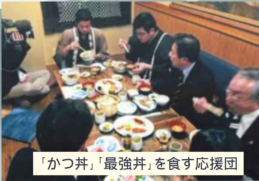
「かつ丼」「最強丼」を食す応援団