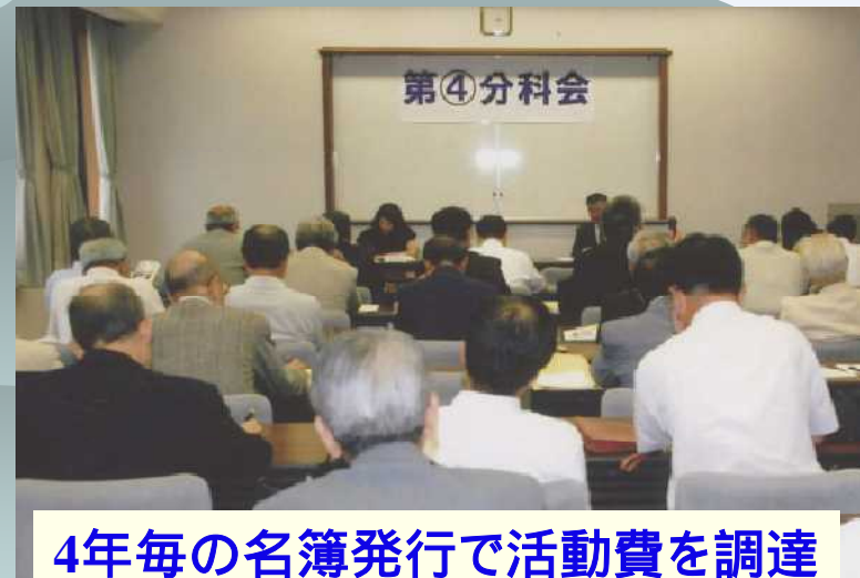
4年毎の名簿発行で活動費を調達