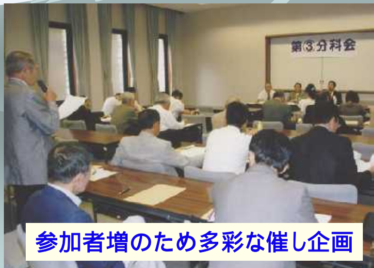
参加者増のため多彩な催し企画