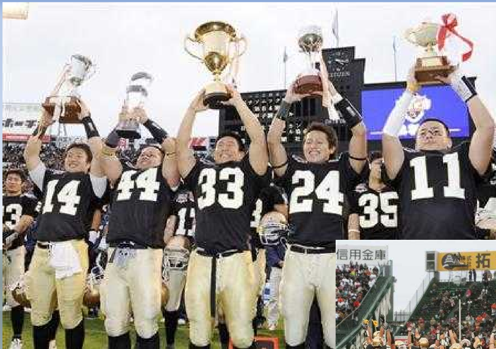
第64回甲子園ポウルを制し、トロフィーを掲げて喜ぶ関西大の選手たち