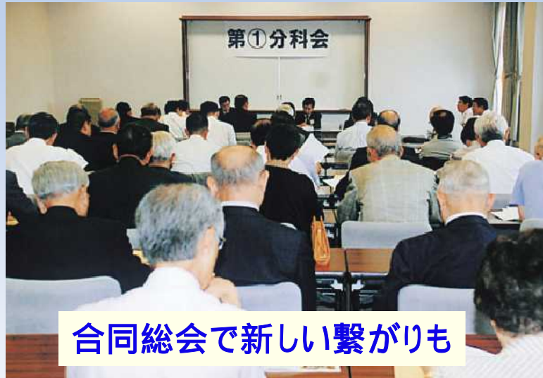
合同総会で新しい繋がりも