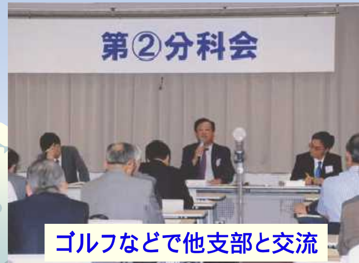
ゴルフなどで他支部と交流