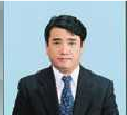
副学長; 上島紳一 大学院・研究推進担当/国際活動推 進担当 = 総合情報学部教授