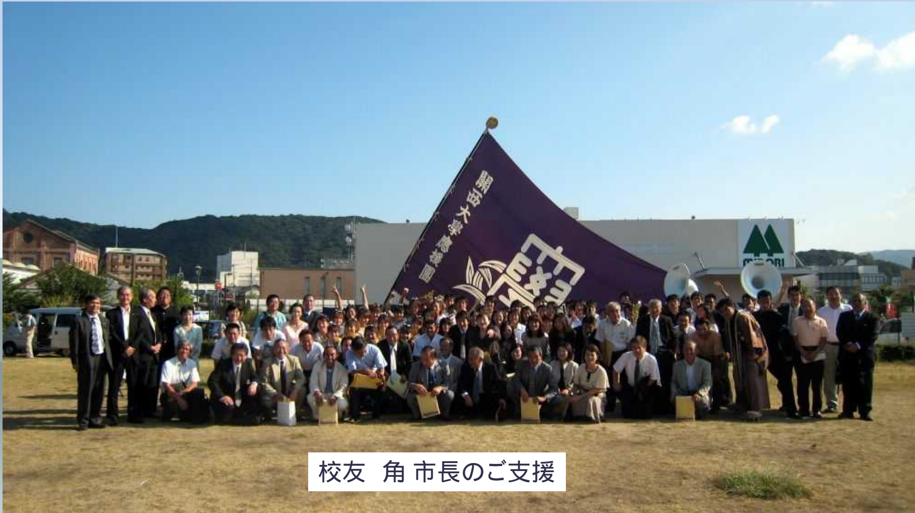
校友 角 市長のご支援