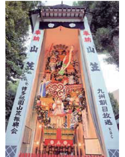
記念撮影人気 NO.1 スポット!