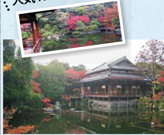
茶室・大広間のある友泉亭