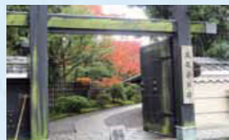
落ち着きのある公園入口