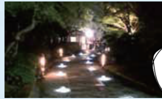
ジャズ演奏を楽しみながら「観月会」を毎年開催