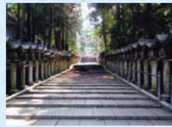
一の鳥居に続く、石畳の参道