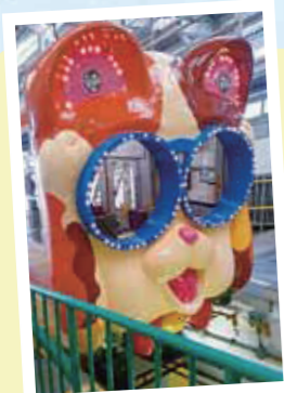
生駒ケーブル (鳥居前駅—寶山寺駅間)の「ミケ」